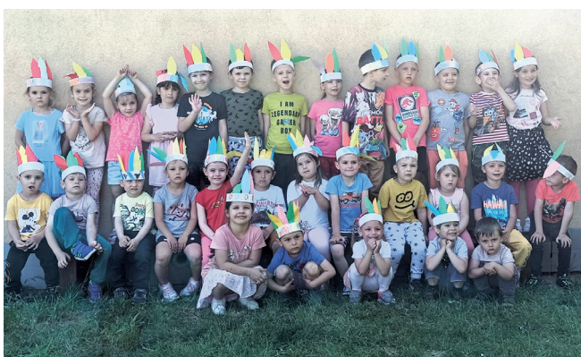
Rozlúčka predškolákov s materskou školou.

Jún: Mesiac, ktorý tradične patrí deťom, tak sme ho oslávili ako inak než súťažami a hrami na školskom dvore.