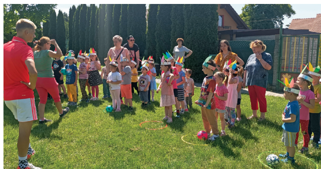
Hurá, prázdniny začínajú...