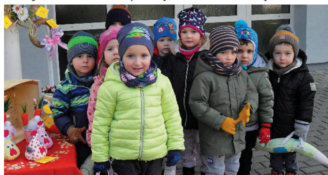
Pri hľadaní Velkonočného pokladu bol na konci vytúžený poklad.