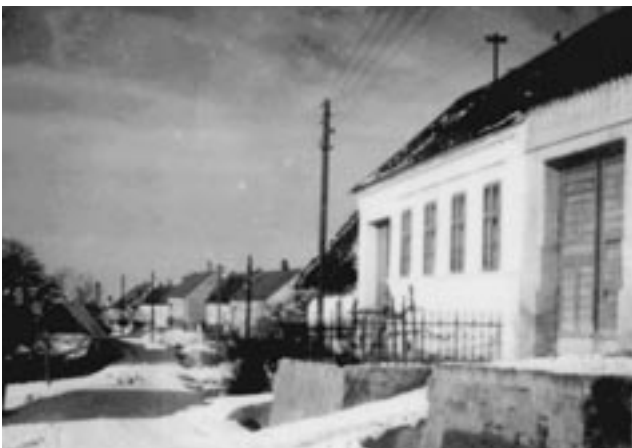
Hrubá strana v zime, koniec 50. rokov 20. storočia.

Píšeme si síce všady, že sme dzedzina z bohatú minuloscú, zachovávanýma zvykma a že máme známu dechofku. Pro istotu. Ale to je asi šecker, co robíme pro tradiciu. Tradiciu si strážíme jak oko v huavje, až tak, že sa ju zatát nigdo z domácich muzikantú neopovážiu aňi odevzdat našim dzetom. Ešte, že sme