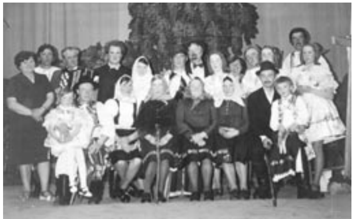
Fotografia z divadelnej hry „Krutohlavci“ z roku 1981.