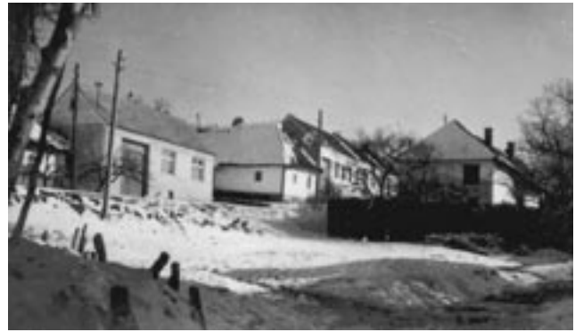
Hrubá strana v zime, koniec 50. rokov 20. storočia.

nezrušili pálenicu. Ale také to neni, co to bývauo. Dnes má každý strach z financú, lebo co sme v Unii, financi ze strachu o svuj chlebiček snorá a kutajú kde sa co páli načerno. Aspoň oni nám pomáhajú zachraňovat pravú unínsku slijovicu. No furt sme lepši než naši susedzi, kerí majú svoju pravú slijovicu bez pálenice, myslím tej úradnej. A myslím si aj s mojim starým, že máme aj lepších fotbalistú jak druhý susedé. Za nás kopú domáci, né prespolané a rači si prodáme hráča, než kúpíme, lebo každá korunka je dobrá, zvlášť dnes. Veru, s peňezi si asi moc dobre nestojíme, lebo ani v kostele z úsporných dúvodú nesvicá šucky svjetua. Enem mi nejde do huavy, jak to, že na cinter máme, a na kosteu né. Ale nemosím zas šeckému rozumjet. Na druhej strane, pri takovem svjetle v kostele zas neni vidzet, co do dá do mješečka.