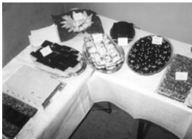
Výstavka zákuskov rok 1997.

V roku 1992 pri 600. výročí vzniku obce bola v krojoch celá dedina, čo bolo zásluhou obetavosti žien v obci, ktoré vytiahli a obnovili kroje, do ktorých obliekli deti od najmenších až po